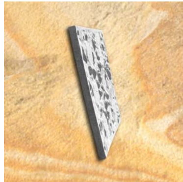
UNIVERSAL-ELEMENT 1m X 1m TYP 1