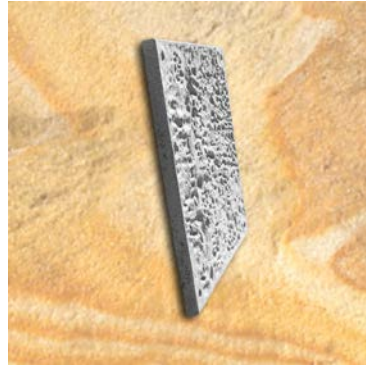
UNIVERSAL-ELEMENT 1m X 1m TYP 2