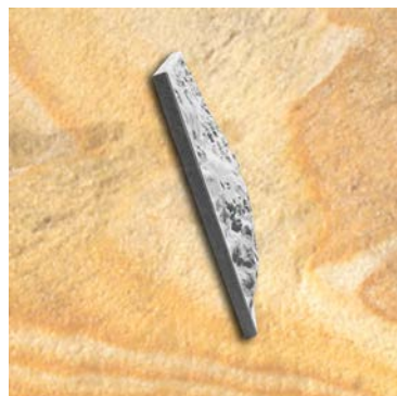
UNIVERSAL-ELEMENT 1m X 1m TYP 4